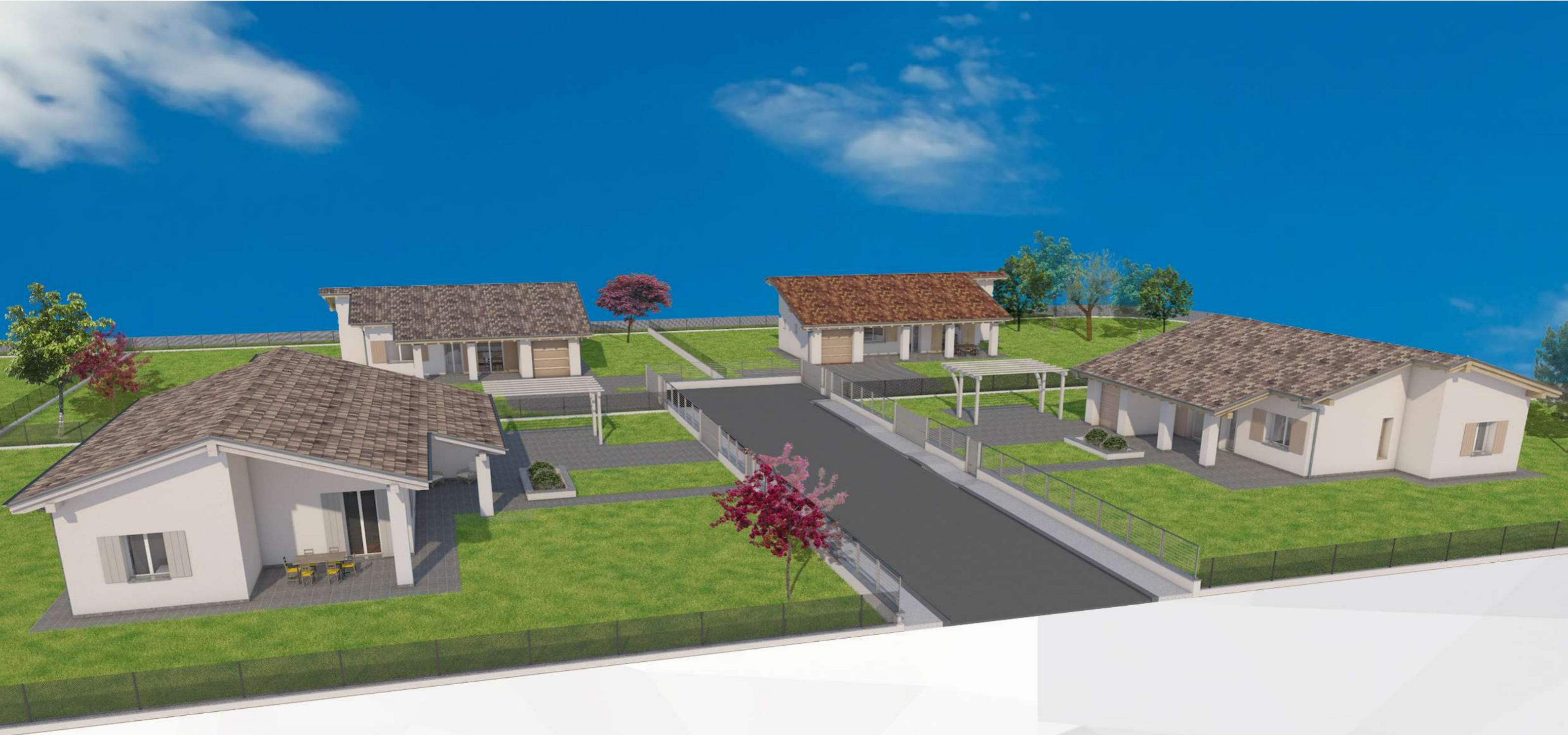
VISTA PROSPETTICA DEL COMPARTO