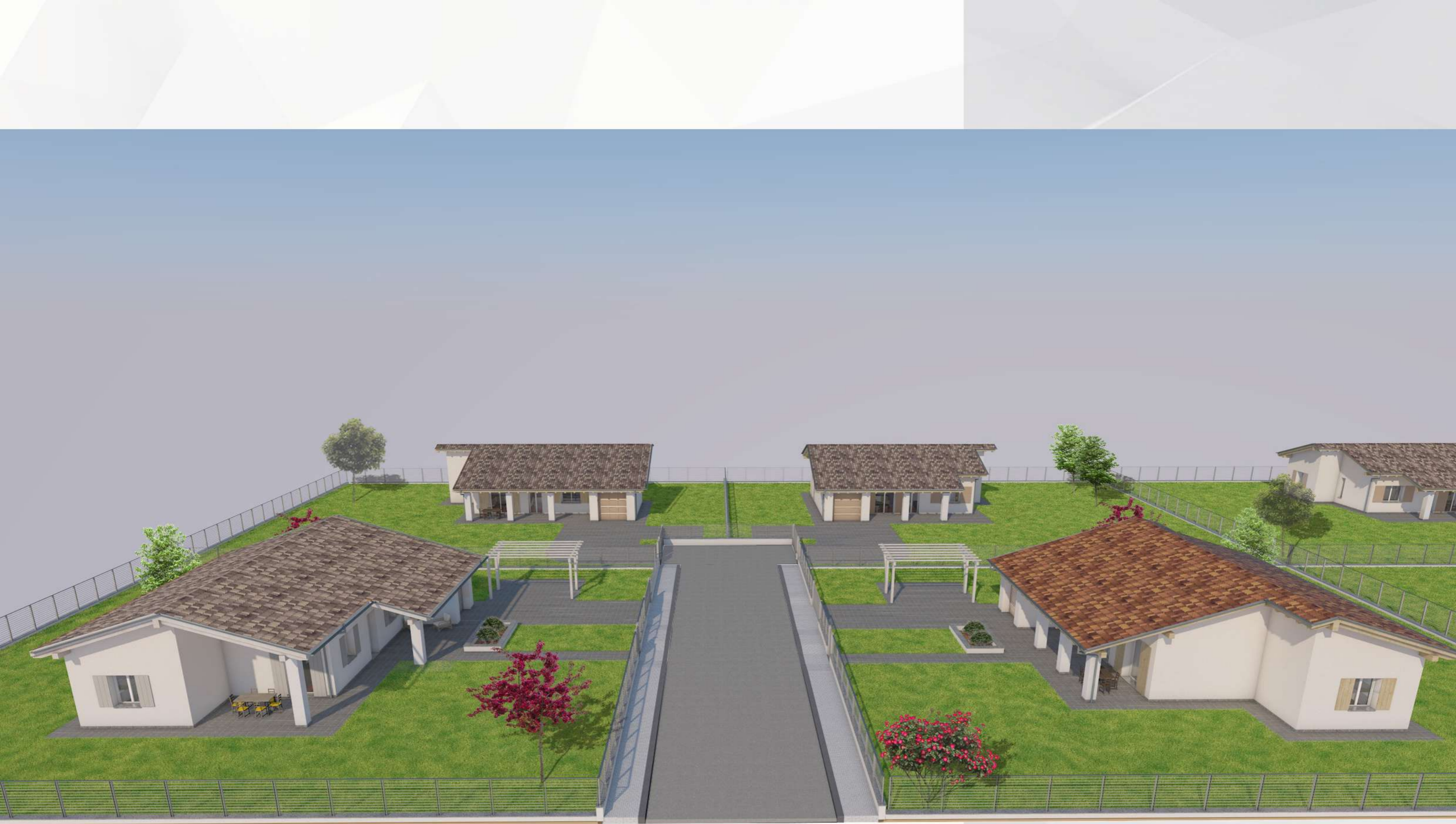
VISTA PROSPETTICA DEL COMPARTO